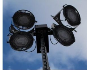
(Variante mit LED Leuchtmittel)